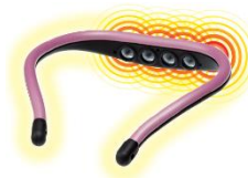
(装着4時間後 イメージ図)